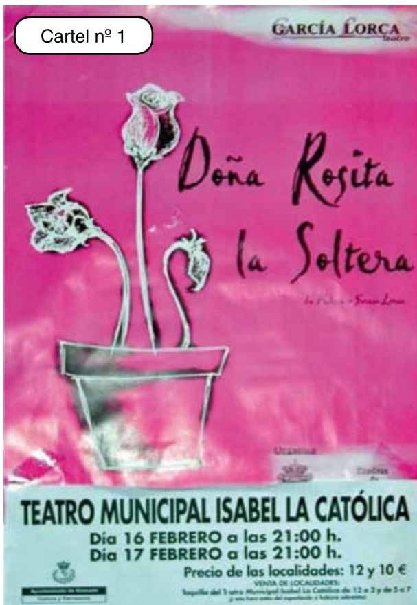
Cartel nº 1