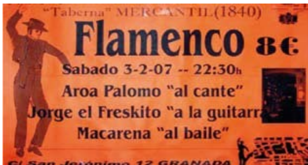
Cartel nº 3