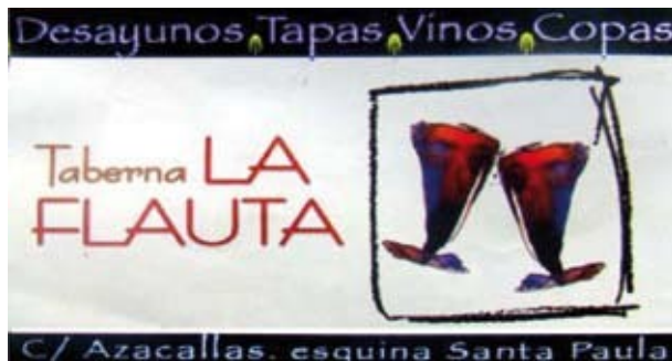
Cartel nº 4