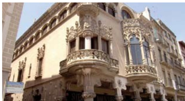
Tarragona. Casa Navàs