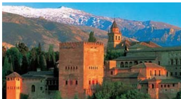
Granada. La Alhambra