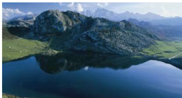
Asturias. Lago de Covadonga