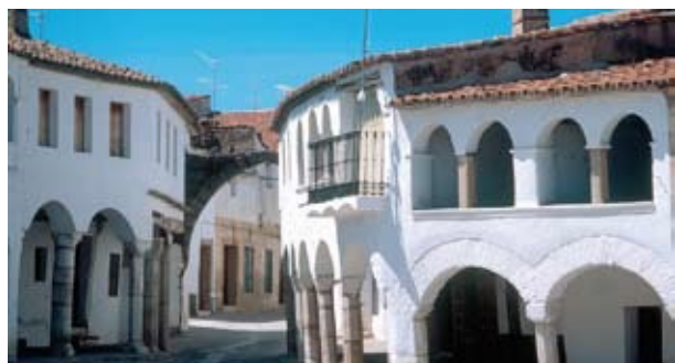
Cáceres. Plaza Mayor. Garrovillas