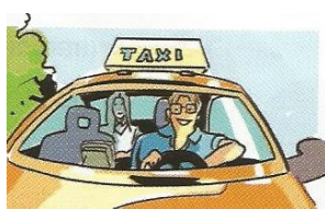
IL / LA TASSISTA