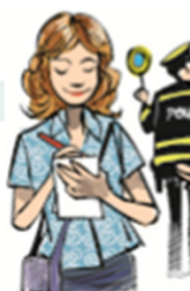
IL / LA GIORNALISTA