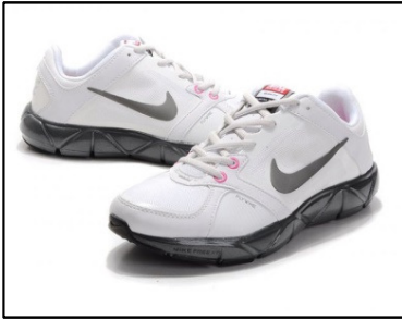
SCARPE DA GINNASTICA