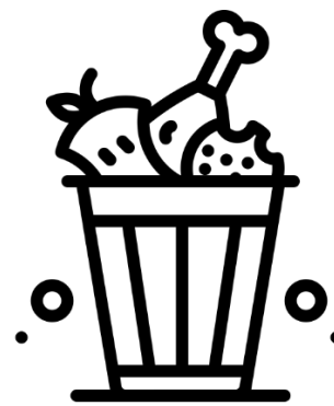
SPRECO DI CIBO